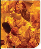
Koyu Kumral Yoğun Bakır Dark Auburn Intense Copper